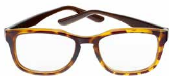
SPICY OFFICE PXFOFSP605