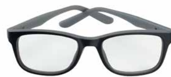
KICK OFFICE PXFOFKI109